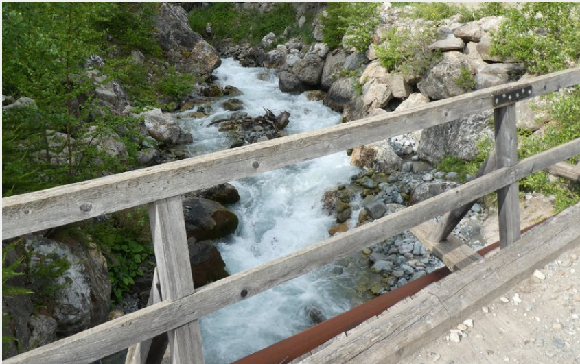
Le torrent du Tabuc