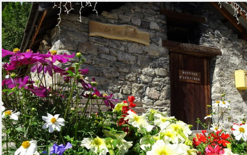
Le four banal