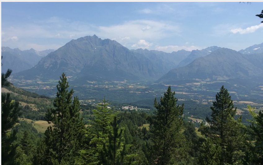
Vue depuis le sentier Dominique-Villars (M. Berger - CDRP)