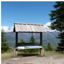
Table d'orientation et aire de pique nique (A)

Au bout du sentier botanique Dominique Villars, prenez le temps de faire une pause à la table d'orientation du Noyer en Champsaur. Très beau point de vue panoramique sur le Champsaur et ses sommets. Table de pique-nique à disposition.