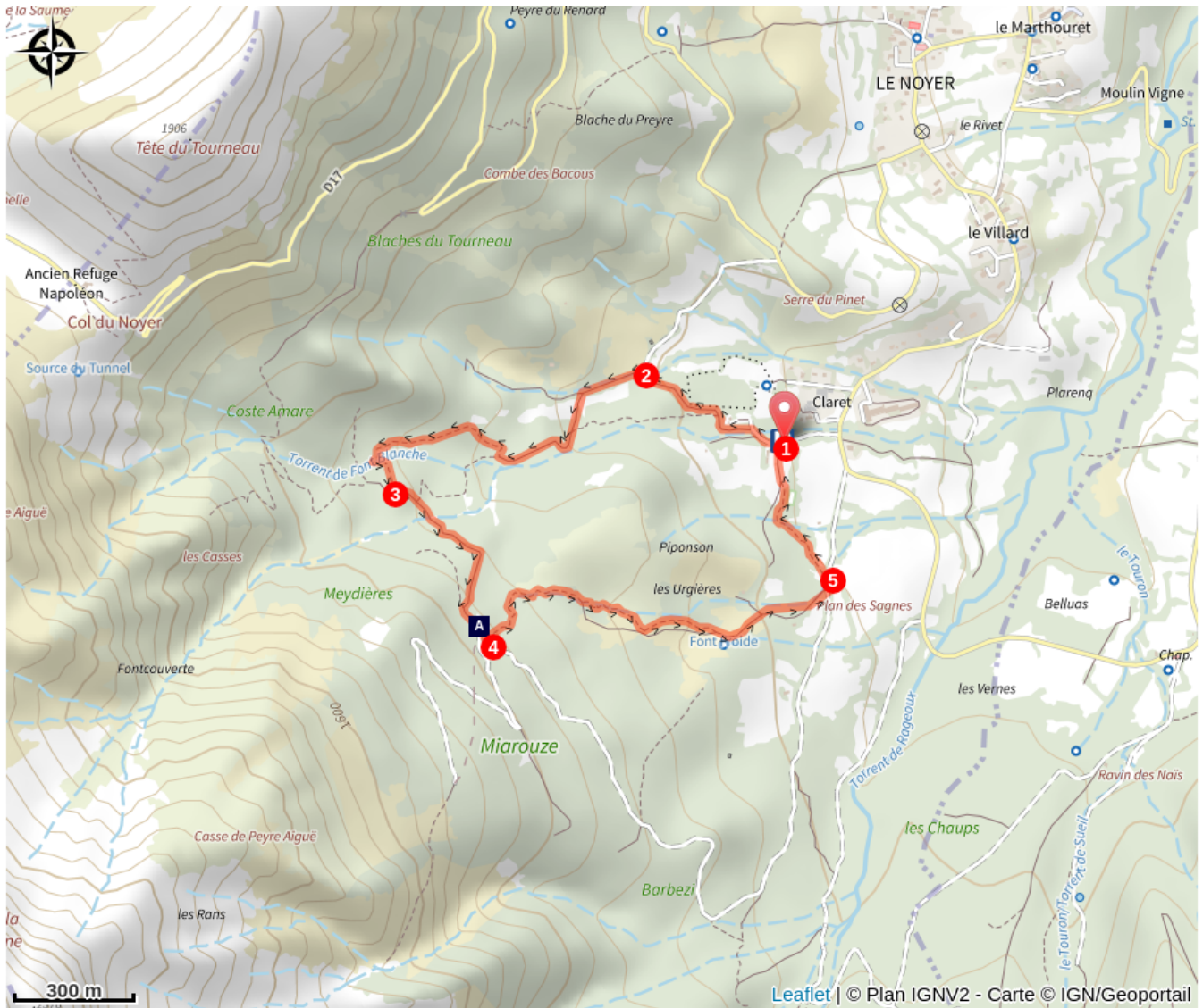
Table d'orientation et aire de pique nique (A)