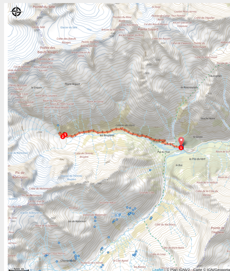
Montée vers le refuge des Bans

Dans un cadre époustouflant, cette randonnée conduit vers un refuge accueillant.