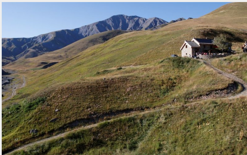
Le refuge du Pic du mas de la Grave