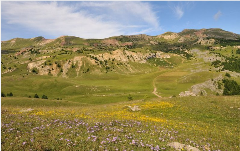
Cirque du Morgon (Mireille Coulon - PNE)