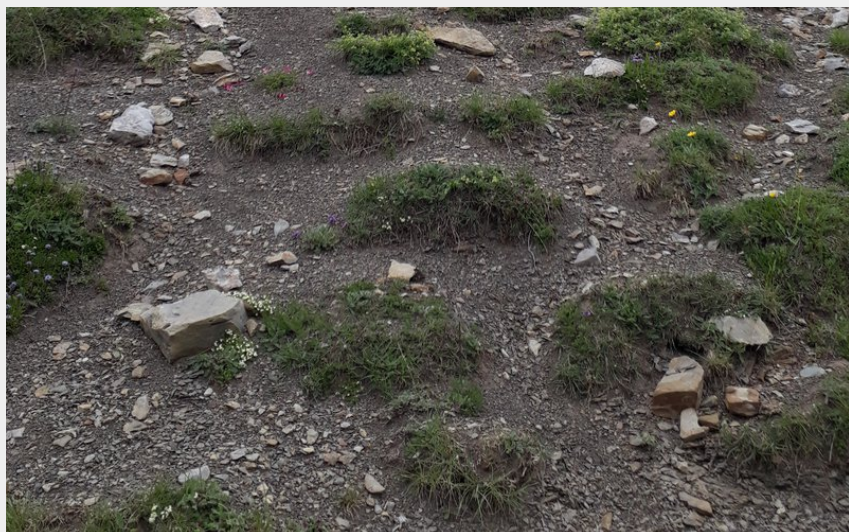
Descente entre sommet et col du Palastre (A. Foll - CDRP)