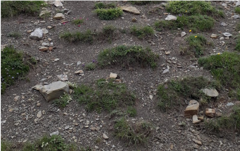
Descente entre sommet et col du Palastre