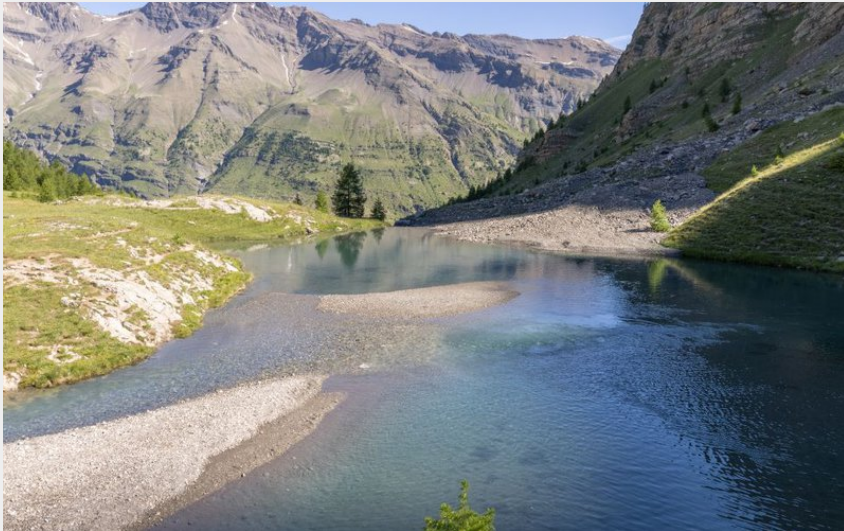
Lac du Fangeas