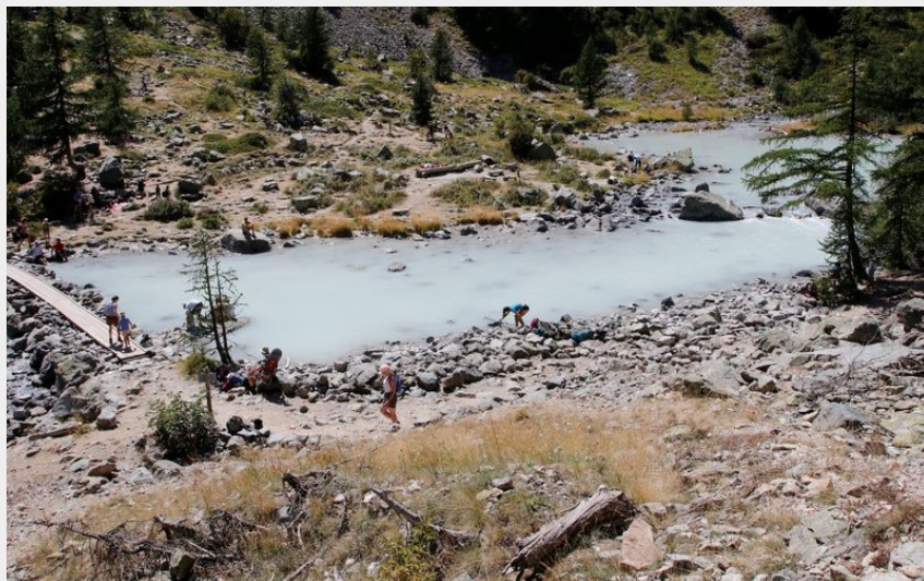
Le lac de la Douche