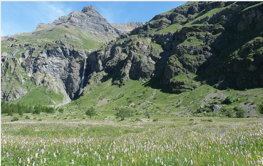
Près Baridon sur l'itinéraire du col de Freissinières