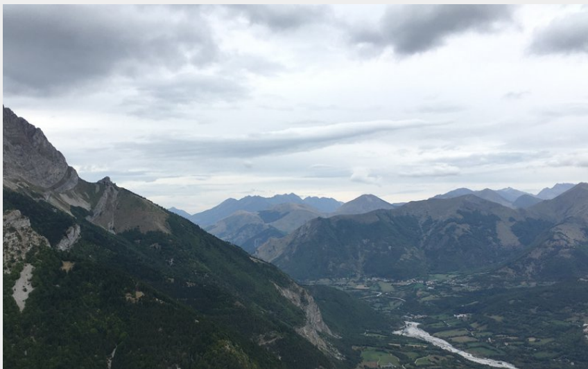
Cette vue !