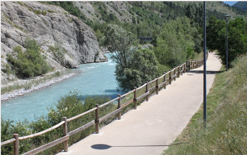
Voie verte (Office de tourisme du Pays des Écrins)