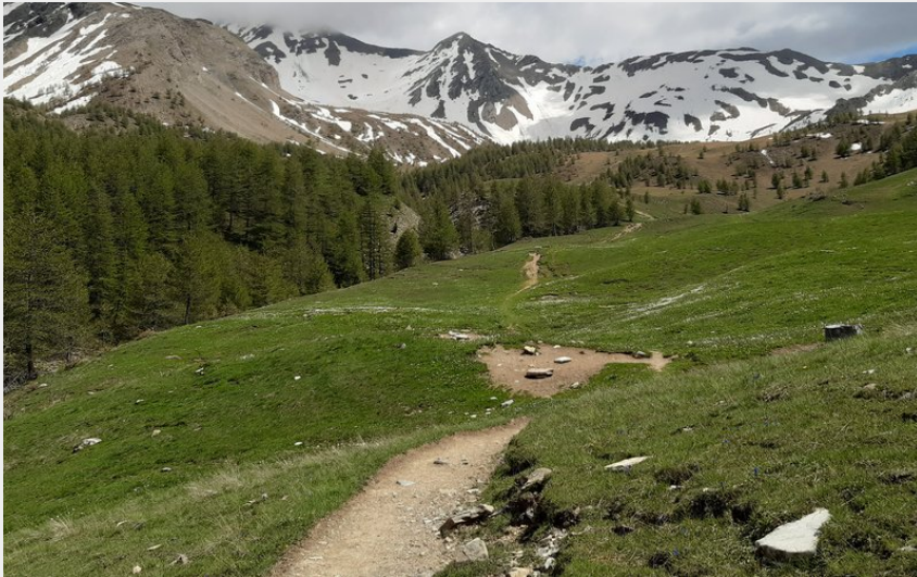
Les alpages avant le lac (florimont.tilliere)