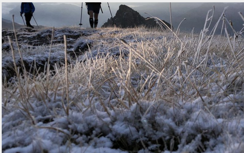
Levé de soleil sur la Cime de la Condamine