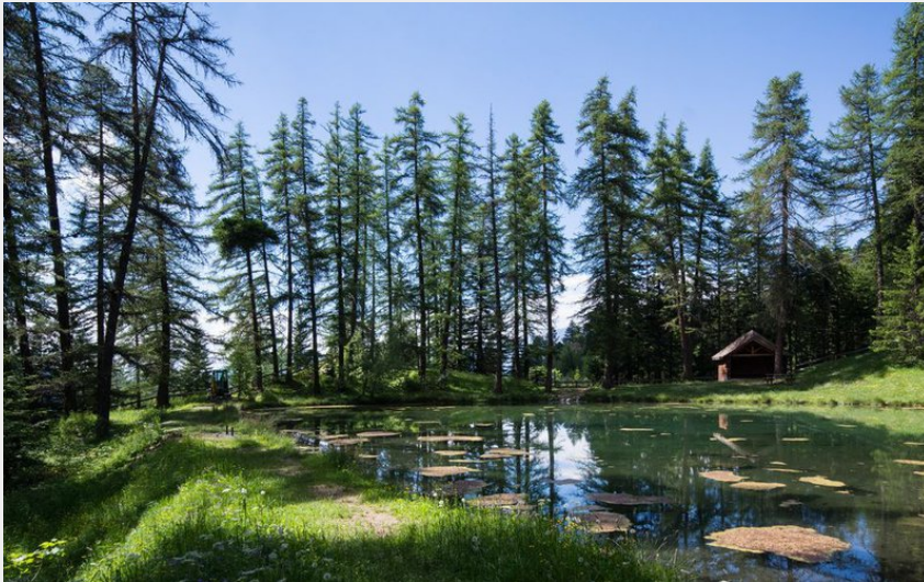
Lac du Lauzerot (Mireille Coulon - PNE)