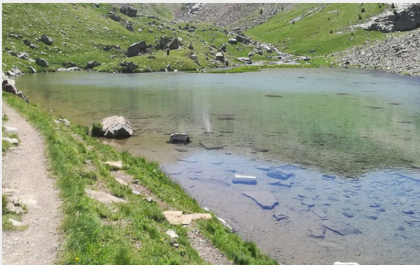
Lac du Crachet et ses montagnes (Amélie Vallier)