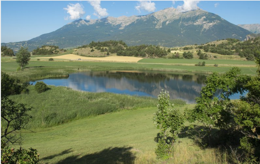
Lac de Siguret (Le Naturographe)