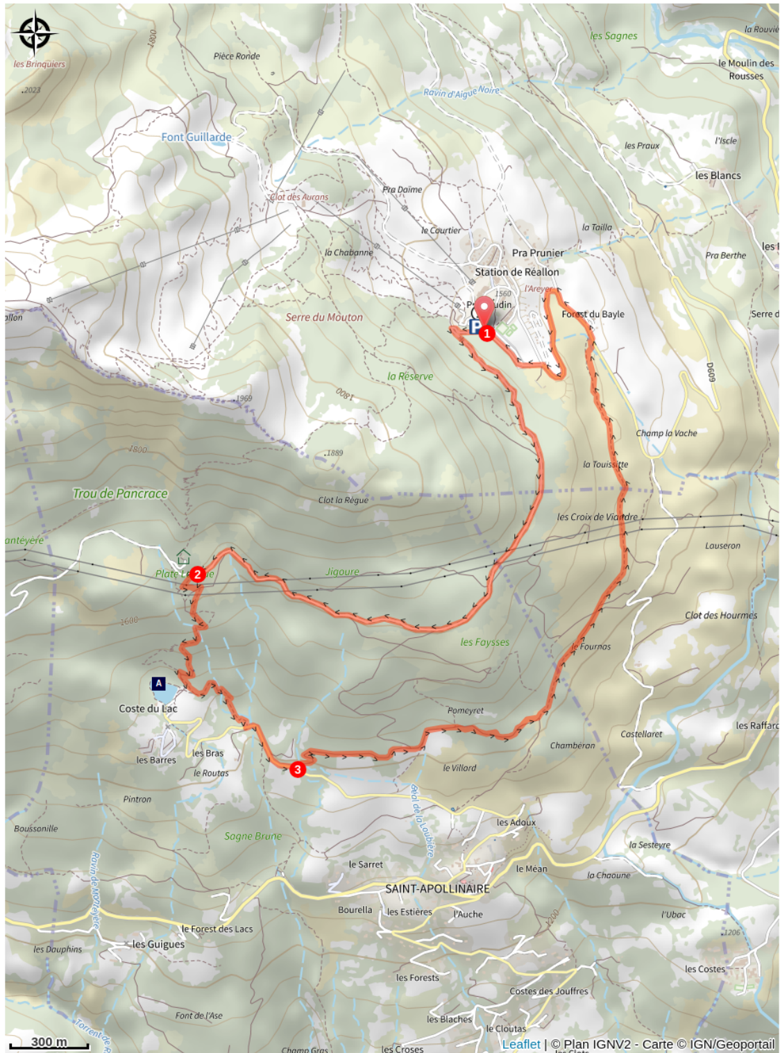
Lac de Saint-Apollinaire (A)