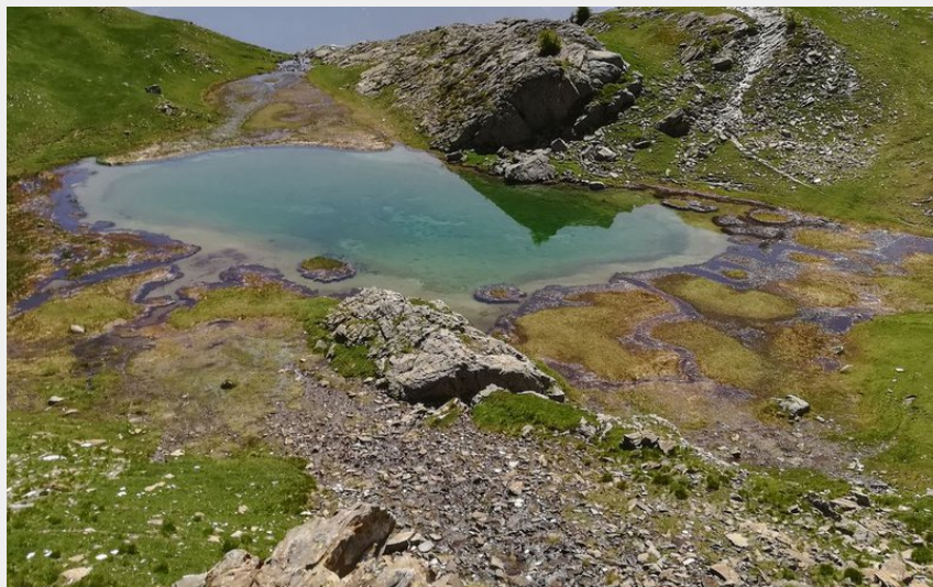
Lac de l'Hivernet en période de printemps (Amélie Vallier)