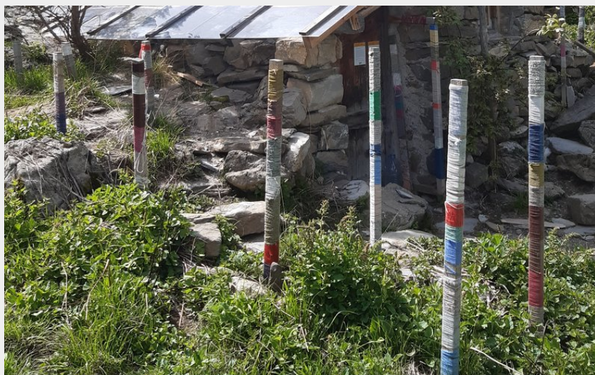
La cabane au berger (florimont.tilliere)