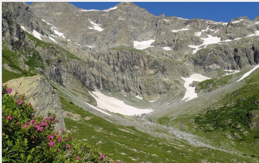
Le vallon de Jas Lacroix, sur la commune de Vallouise