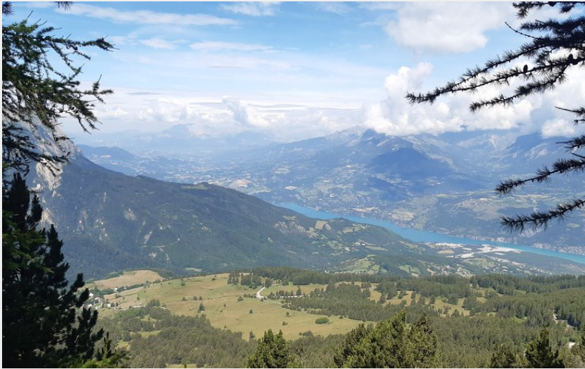
Une brèche dans la forêt (florimont.tilliere)