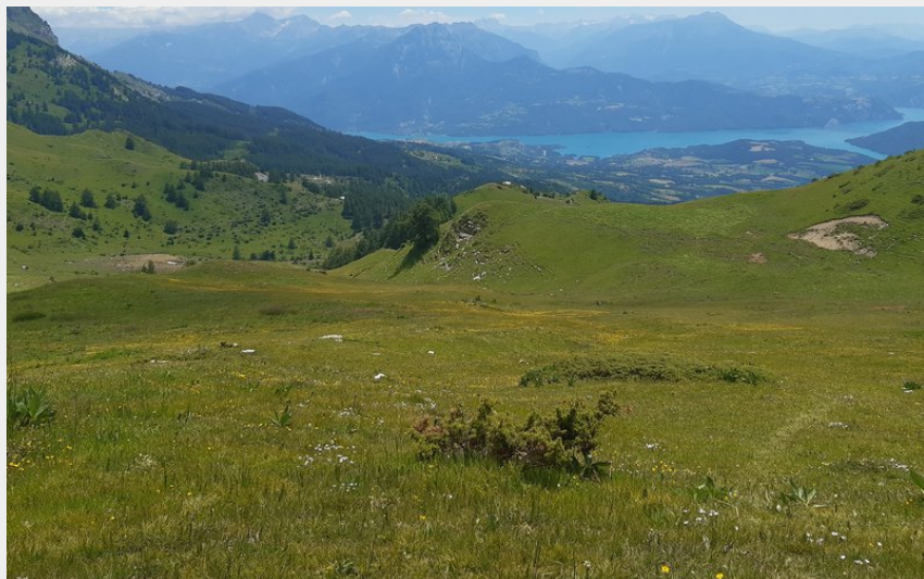
Alpages sous le col (florimont.tilliere)