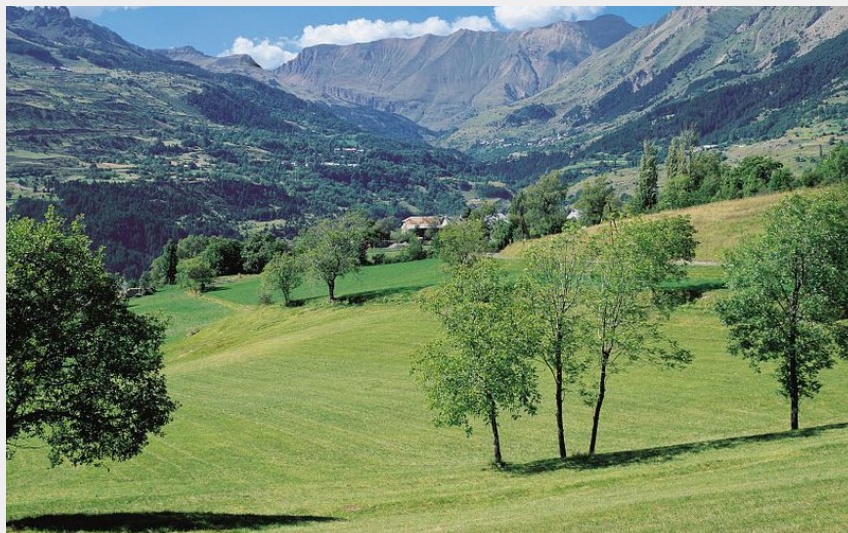
Vallée de Réallon, avec vue sur le col de la Coupa au fond (Stéphane D'Houwt - PNE)