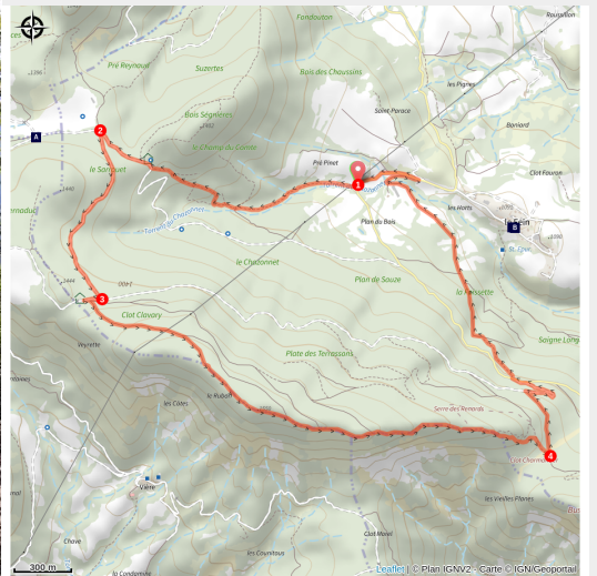
Une balade familiale

Cette balade dans l'arrière-pays de Chorges permet d'entraîner toute la famille à travers pâturages et forêts sur les contreforts du mont Colombis.