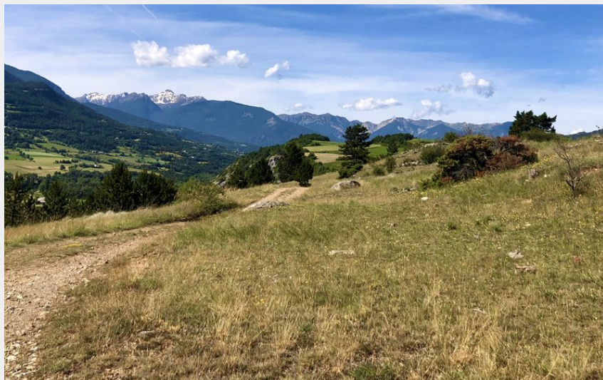
Plateau d'Herbonne (Alexia Mironé)