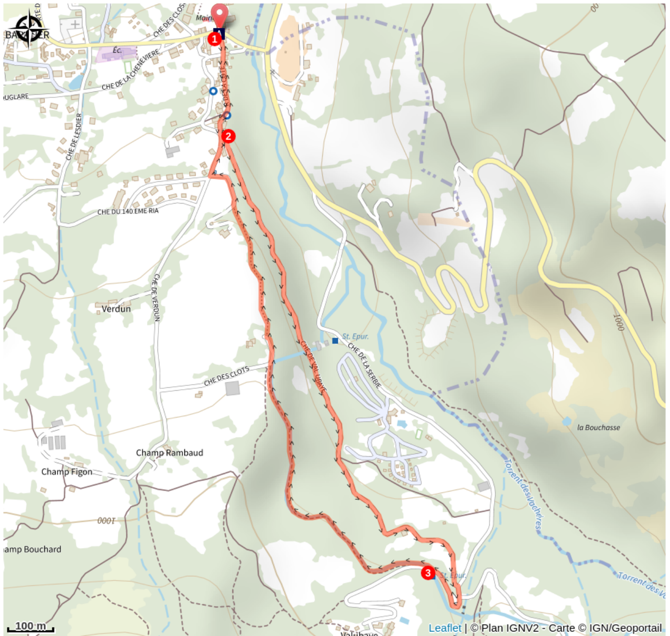
Village de Baratier (A)