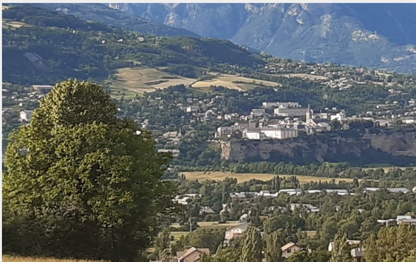
La ville haute d'Embrun (florimont.tilliere)