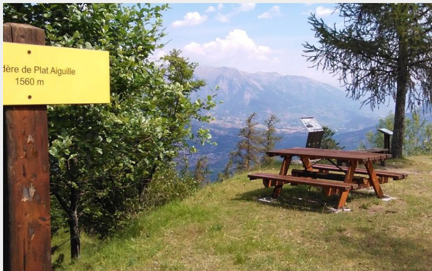
Belvédère de Plat Aiguille (Office National des Forêts)