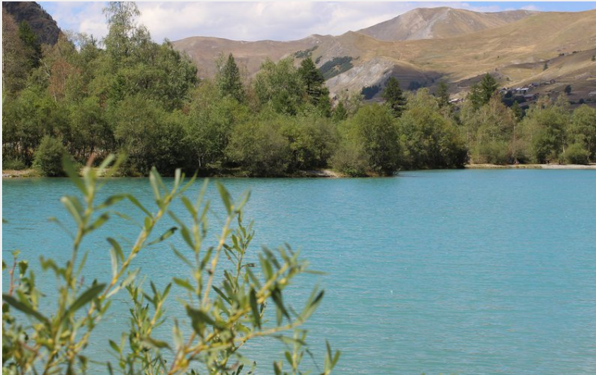
Les hameaux de Villar depuis la Gravière (M.Molinari)