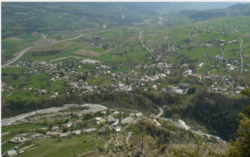
panorama depuis le belvédère (etienne.charles)