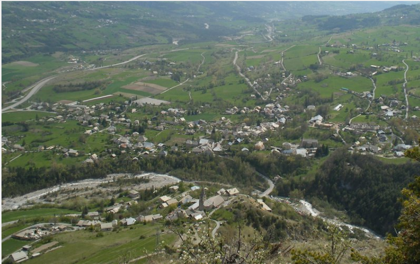
panorama depuis le belvédère (etienne.charles)