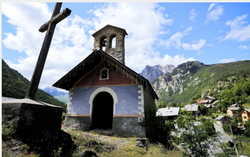
La Bâtie des Vigneaux