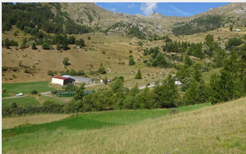
Au-dessus des Drac