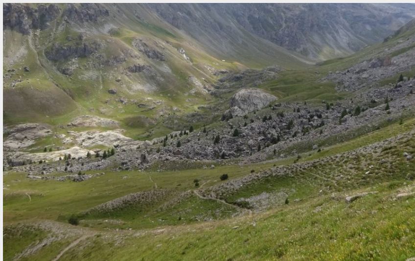
Au fond du vallon, la Font Sancte