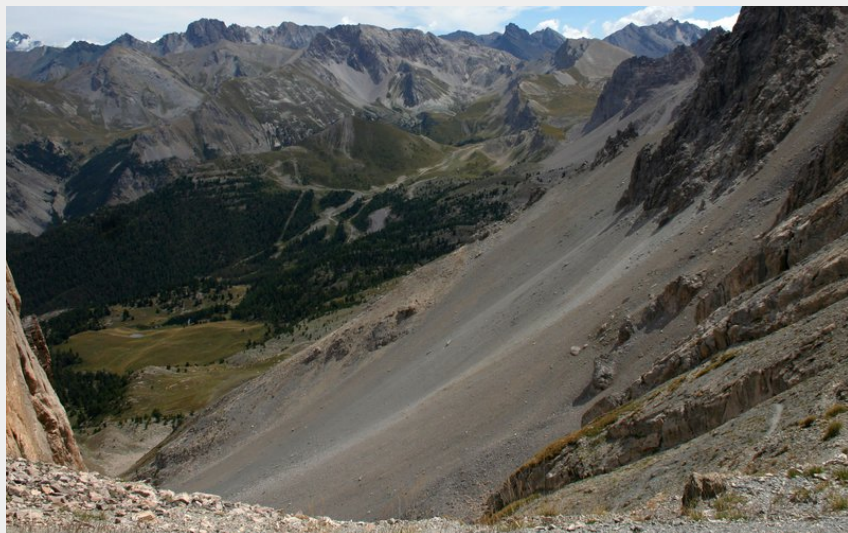
Depuis le pas du curé (Benjamin Musella - PNR Queyras)