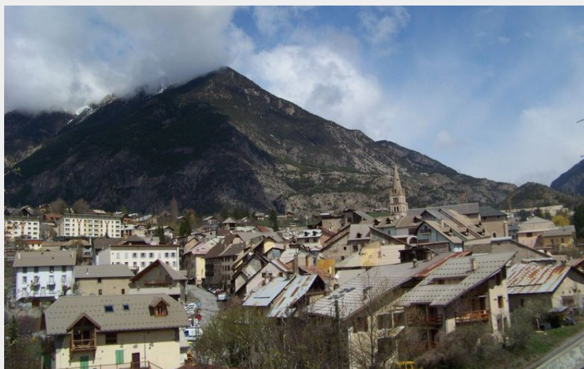
Guillestre vu du sentier

CC du Guillestrois et du Queyras - Guillestre