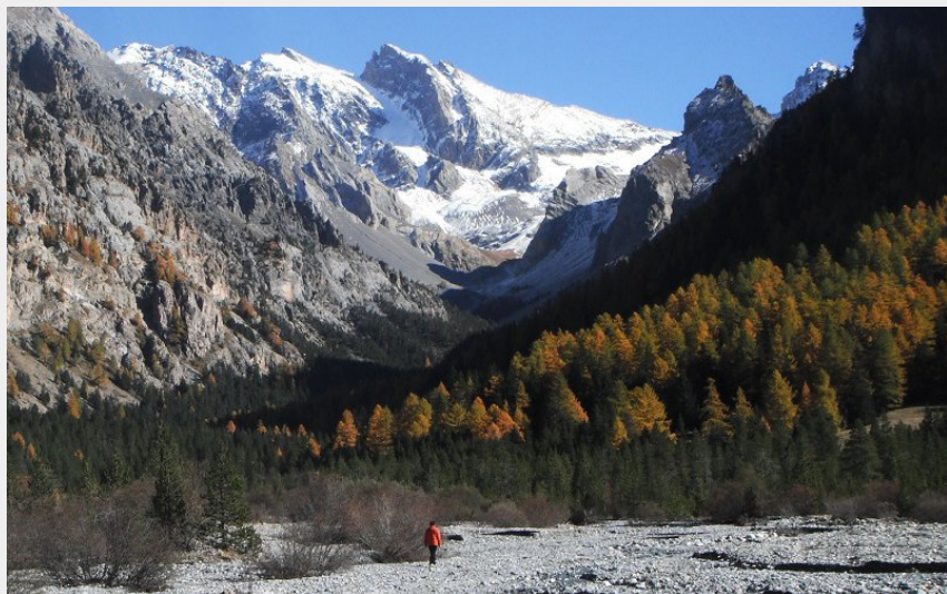
Val d'Escreins