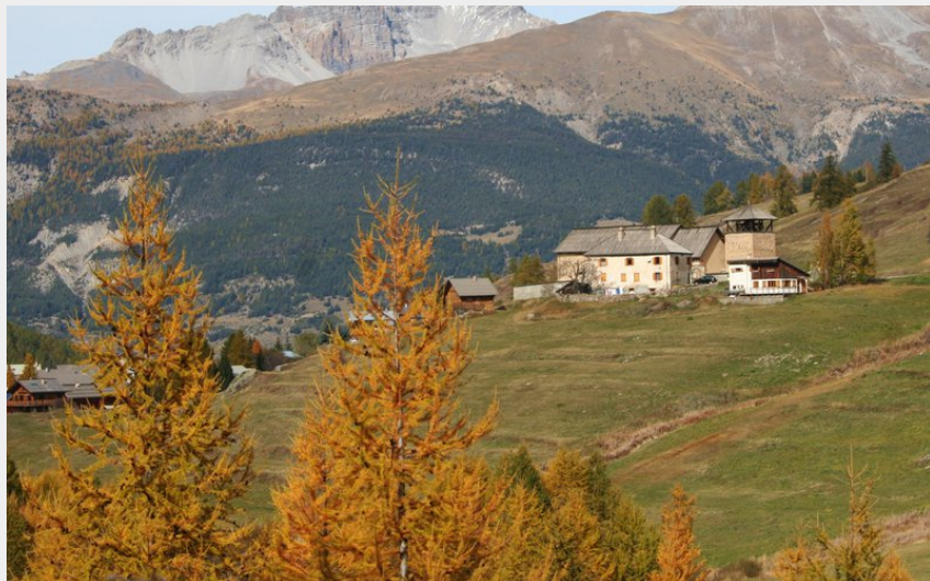
Eglise Saint-Romain vue depuis le début de la montée