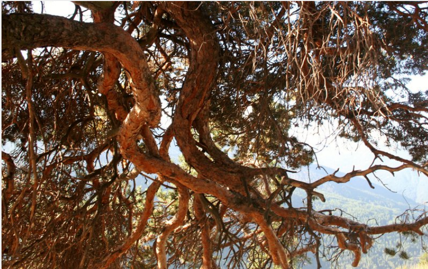
Les dessous d'un pin Sylvestre