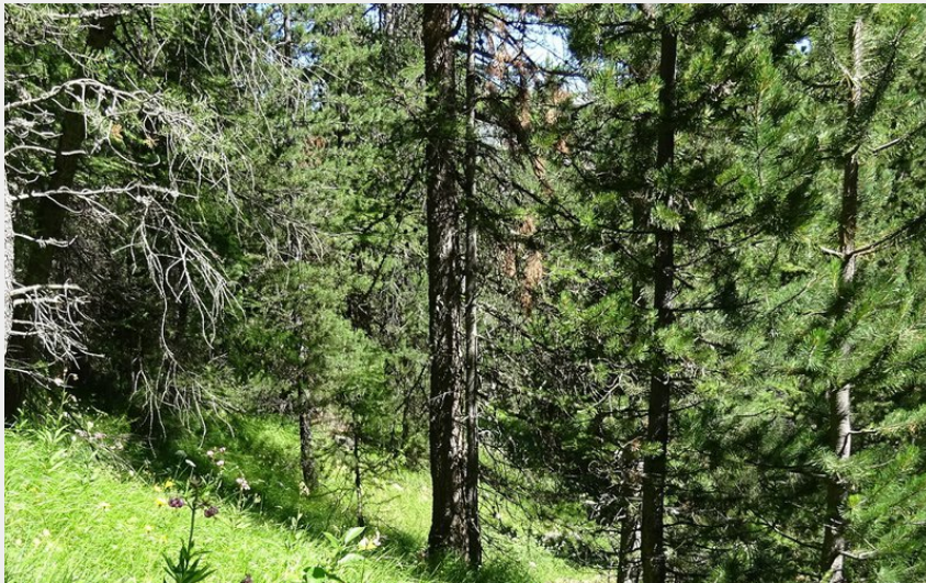
Station de Lys martagon sous mélézin