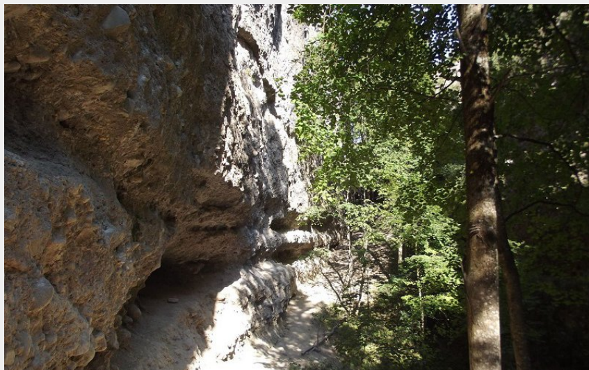
Falaises de poudingue de la Rue des Masques