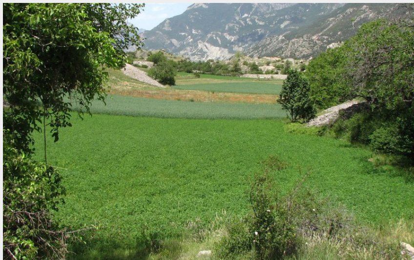
Prairies vers Champcella (CC Guillestrois-Queyras)