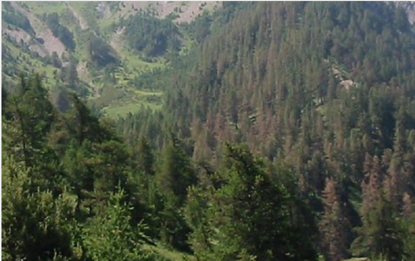
Pic du Clocher (CC Guillestrois-Queyras)