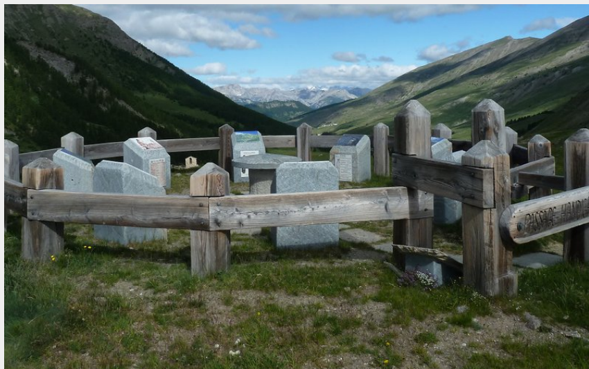
Lieu de mémoire (Association Les Fountgillencs.)