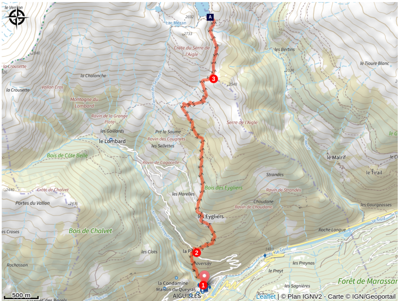
Lac du Grand Laus (A)