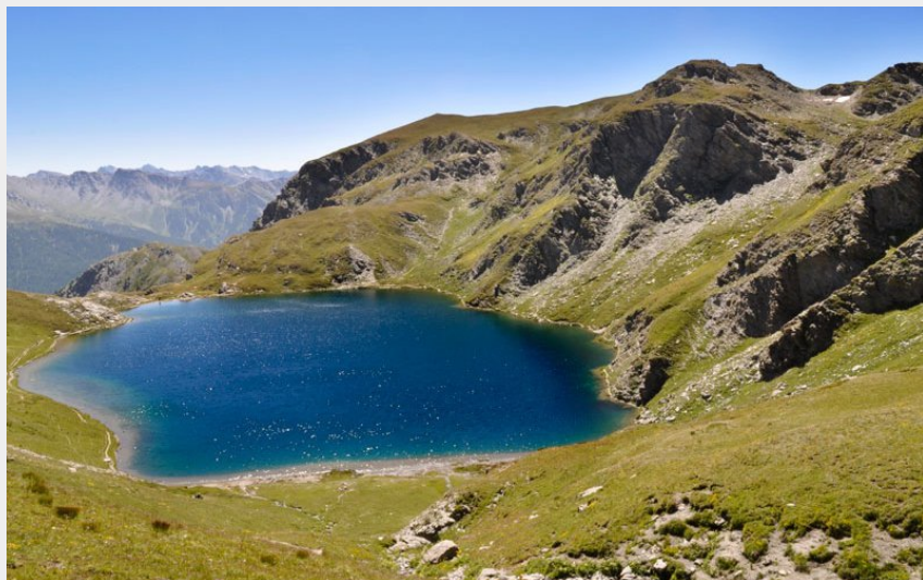
Le grand Laus vue depuis le col du Malrif (Luc Soulié)