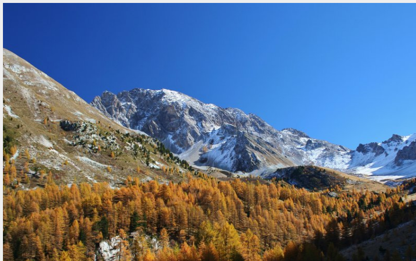
Vallon du col Tonchet (Benjamin Musella - PNR Queyras)

CC du Guillestrois et du Queyras - Ceillac