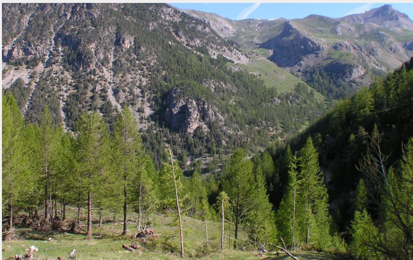
Vue depuis le sentier (CCGQ)