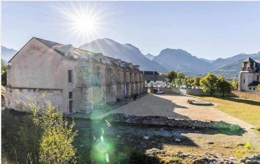
L'arsenal de Mont-Dauphin (Thibault Blais)