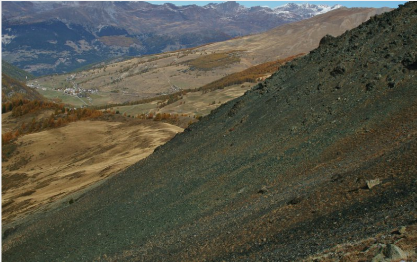
Vue depuis le pied du pic de Cascavelier