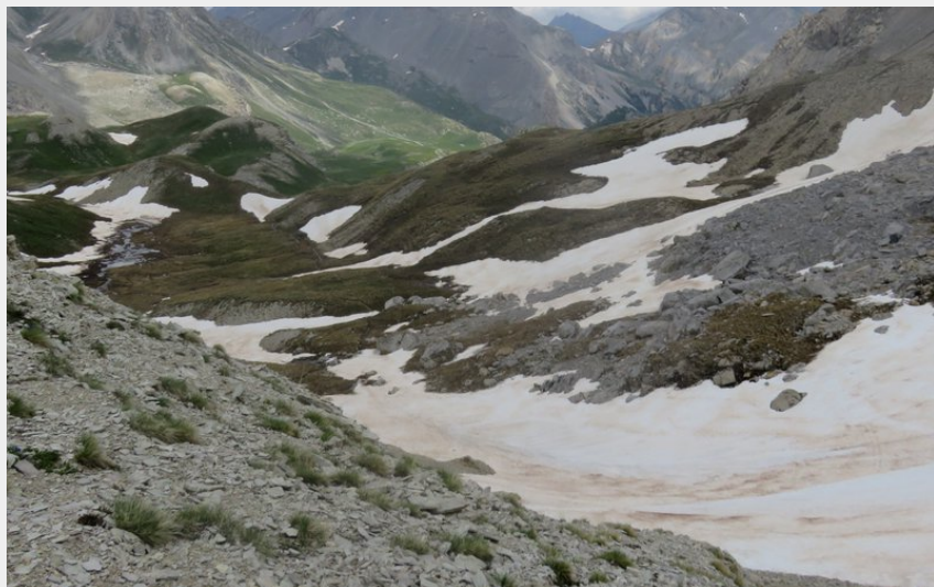
La descente du vallon du torrent du Peyron