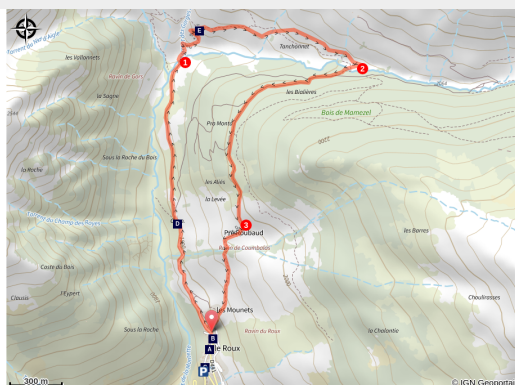
Hameau de Pra Roubaud (Benjamin Musella - PNR Queyras)